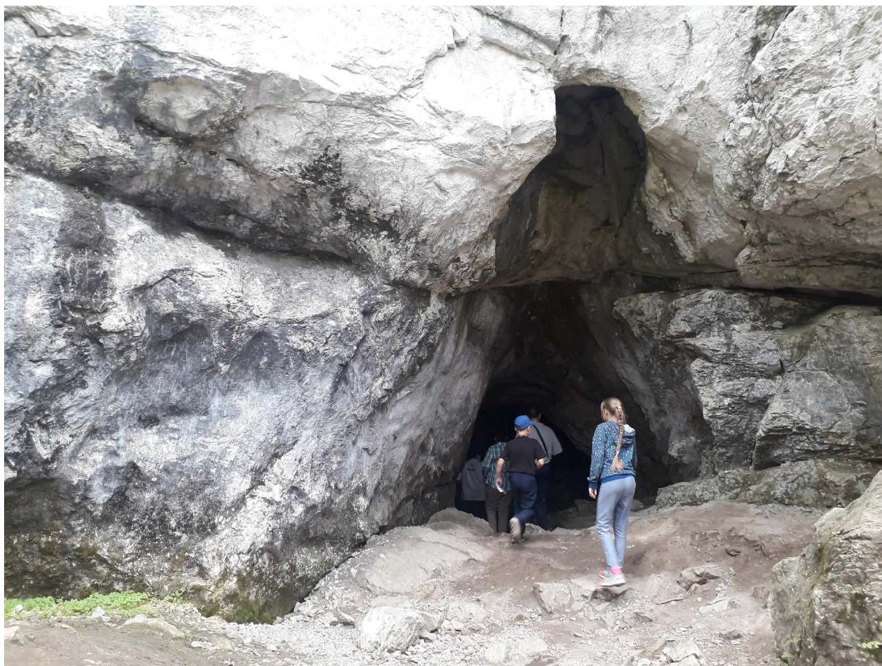
Вход в пещеру Стоянка древнего человека.

Древний человек ловил в реке Серге рыбу, охотился в тайге на лесного зверя, а потом устраивал пиры - жёг костры - и прятался в пещерах, которые природа устроила в скалах.