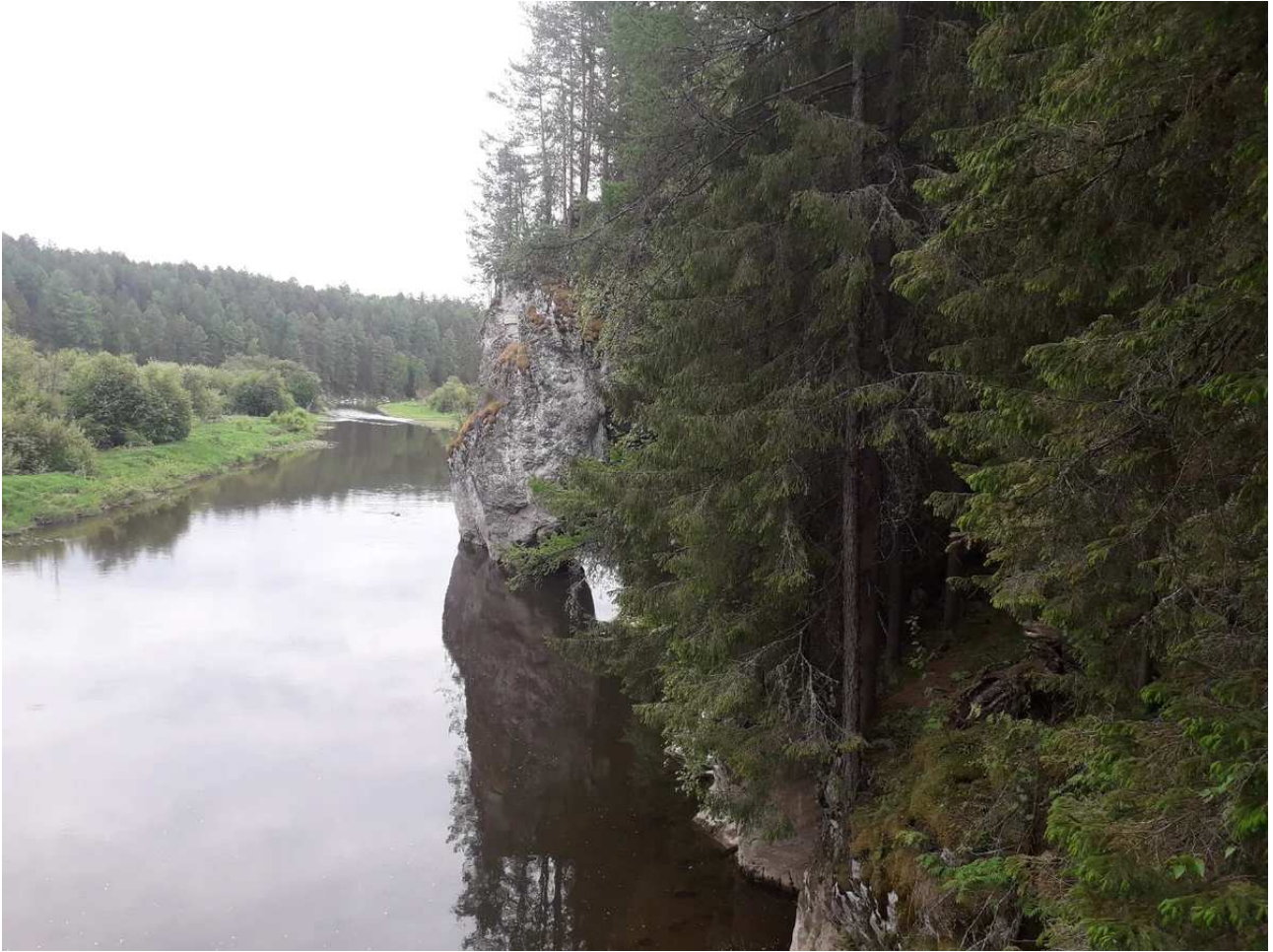
Виднеется Дыроватый камень.

Раскопки велись у скалы Дыроватый камень - практически сразу за ним в огромном камне на берегу открывается вход в пещеру "Стоянка древнего человека". Подъем к скале идёт по очень удобной металлической лестнице - и флору местную туристы не топчут, и идти комфортно: красота!