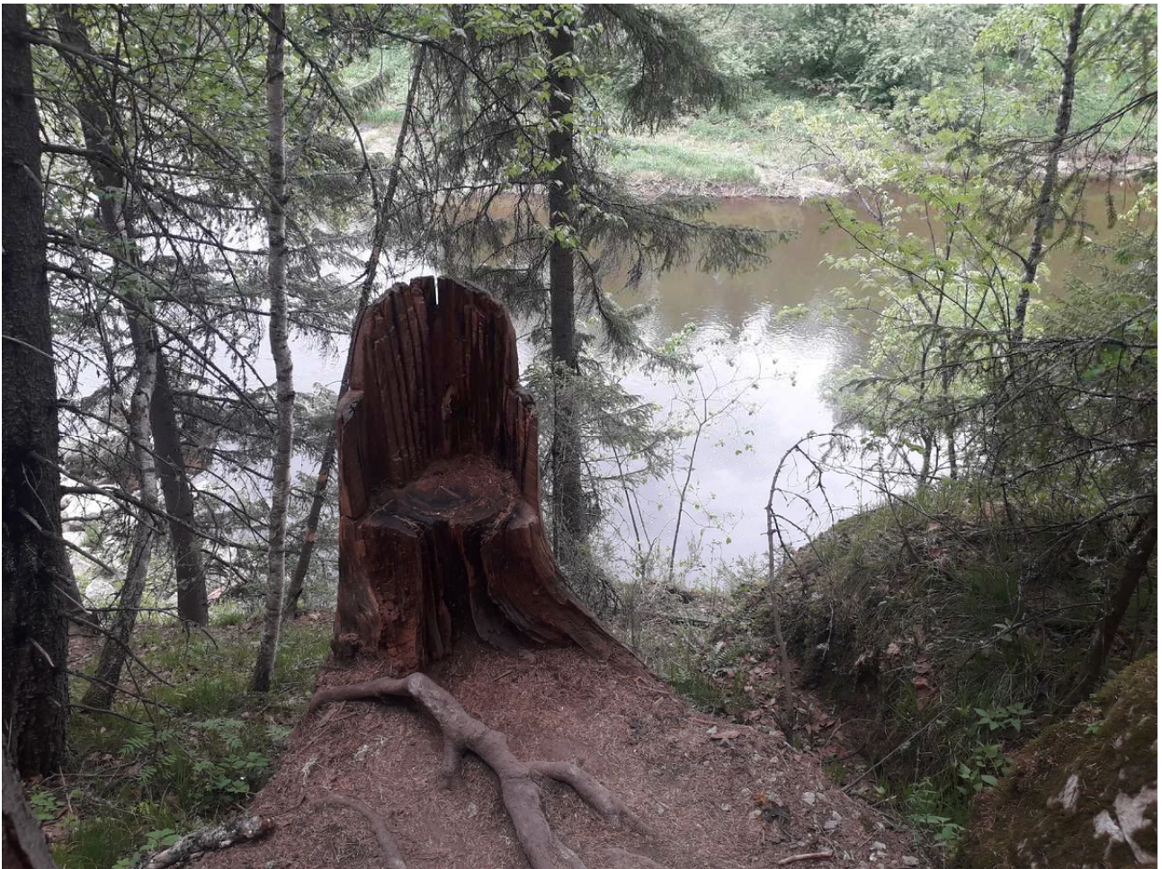
Серга в наши дни немногочисленна.

Причём это были не осёдлые племена - нет: древний человек мог выжить, только переходя с одного места на другое. Однако к Серге племена возвращались снова и снова: здесь было сытно и удобно.