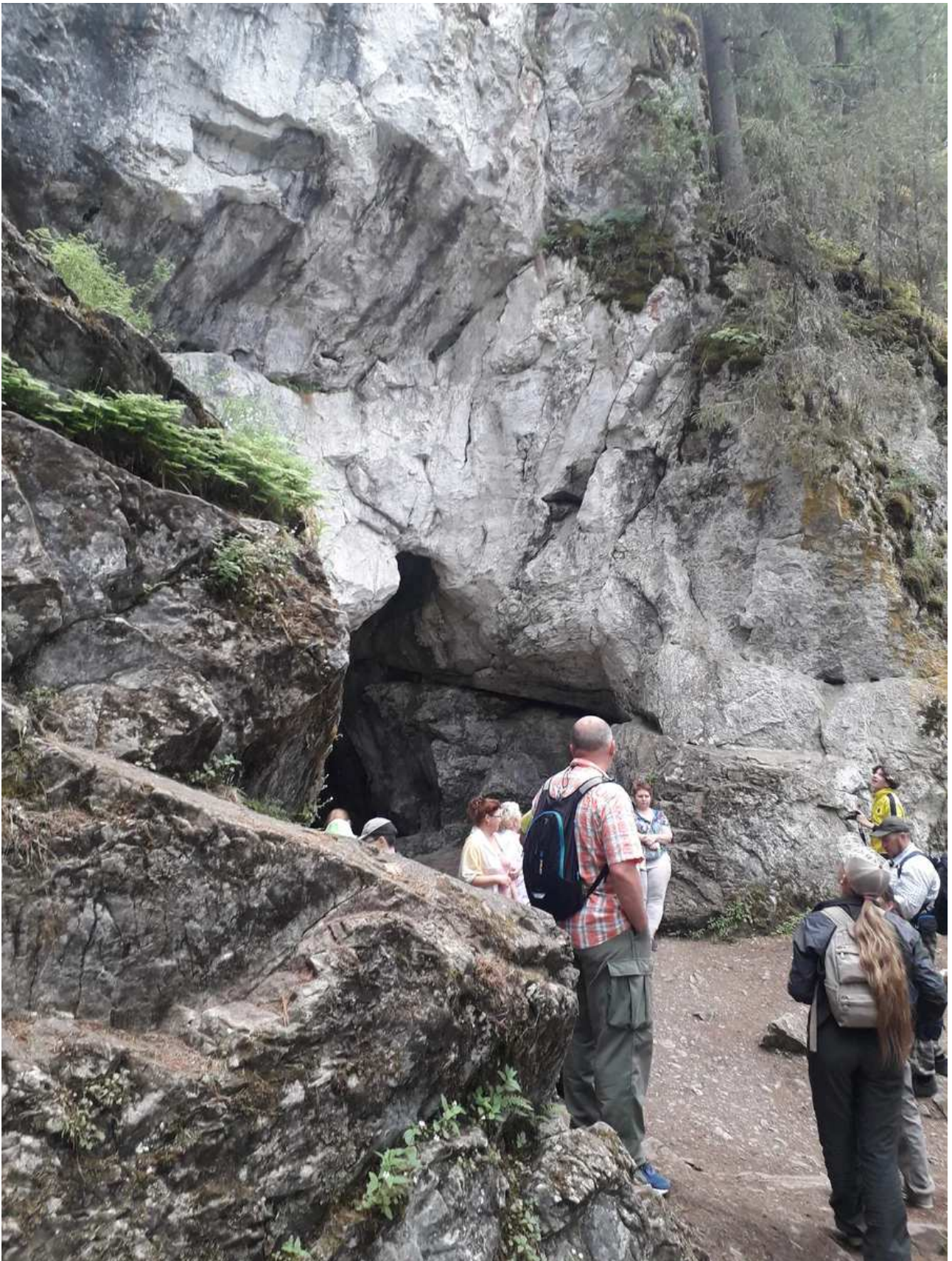
Скала, где находится пещера, имеет внушительные размеры.